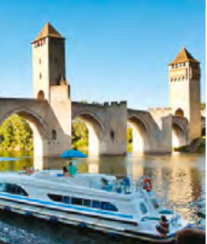
1 - Pont Valentré