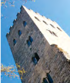
5 - Tour du Pape Jean XXII