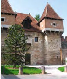
7 - Barbacane