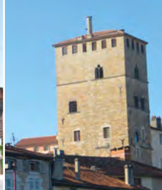
9 - Château du Roi