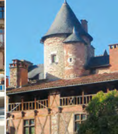
14 - Maison Henri IV