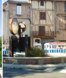
13 - Quartier St Urcisse & Horloge à billes