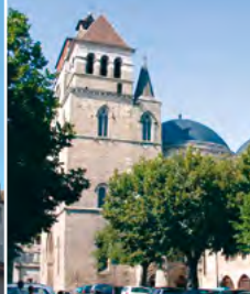
12 - Cathédrale St-Etienne & Halles